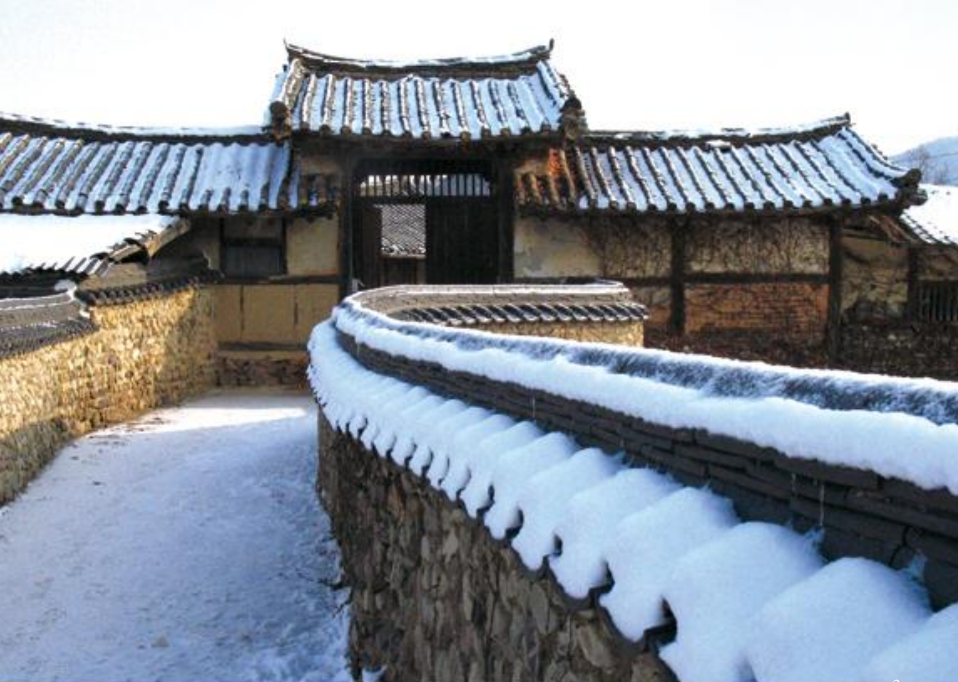
전 마을 사람들이 인근 강에서 주워온 돌과 흙을 섞어 쌓기 시작했다는 토석담. 돌담 길 끝 새하얀 눈을 이고 있는 고택 풍경이 멋...