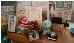
97才の女性の作品 を販売するお店

72歳女性、独居（子供は県外）。認知症初期支援チームが関わる事例、パーキンソン病、リウマチの診断。 両手のこわばりやふらつきの症状。まだデイサービスに通う状態ではないのではないかと見立てたCM（ケアマネジャー）は医師と相談。医師から社会参加活動を進められる。花や本が好きという強みを生かし、SCは介護事業所での花壇の世話や地域の図書館でのお手伝いをいう役割を見つけてきた。