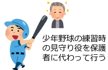
少年野球の練習時の見守り役を保護者に代わって行う

SCがママ友と談笑している際に、子供のソフトボールチームで、練習中の運動場に他の子供が入らないように見守る当番があるが、それが面倒だという話を聞き、小学校近くに住む野球好きの高齢者の通いの場（役割）として最適ではないかと考え提案した。応援できるチームが出来たことは生活の張りになっている。