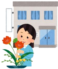
通院している病院の口 ビーで得意の生け花

70代女性。地域のサロン活動等への参加が消極的だが活動的な生活につなげたいと、地域ケア会議に提案された事例。趣味で華道をやっていたが、最近は行っていないという情報から、SCは定期的に通院している整形外科を訪問し、ロビーに作品を飾らせてほしいと提案し、了承される。月1回の役割だが、その役割を果たすために、活動的な生活が維持されている。